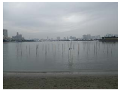
海苔生長 暖かく見守ってください