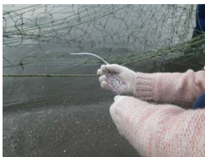
みんなの思いをフラインクに