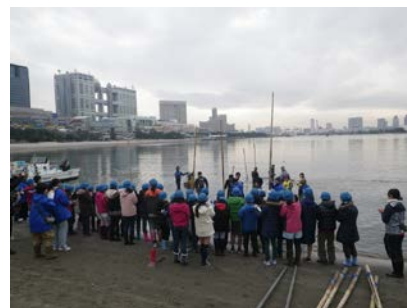
ひびの立て方わかるかな