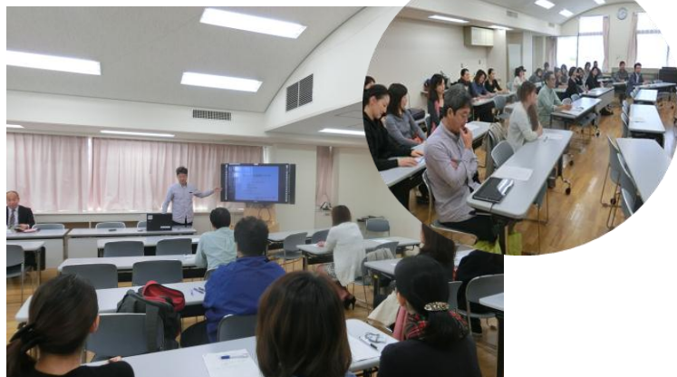
海苔の安全性の講話

お台場海苔づくり実行委員を募集しています。 また、お台場海苔づくりに参加したい人も募集しています。 興味のある方は、ご連絡待ちしています！