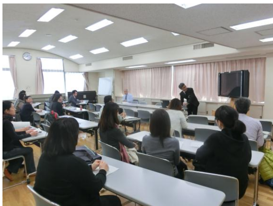
昨年の海苔づくりの説明