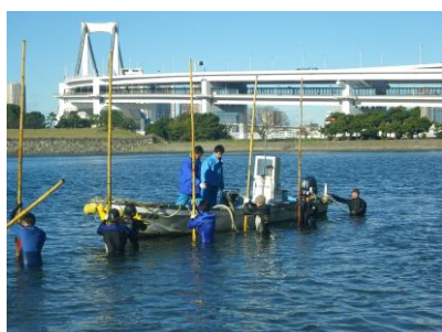
ひび(支柱)を立てます