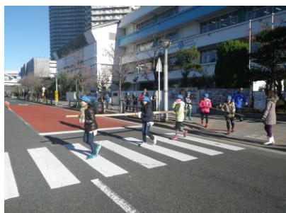
ひび(支柱)を運びます

網を張った最初の3日間は、海苔網が海水面より上に出ないようにする必要があります。しかしそれ以降の海苔網は、海水面より上に出ている時間も必要で、実行委員やお台場学園5年生の保護者の皆さんが、今後も何度か海に入り海苔網の高さを調節する作業や観察を行っていきます。