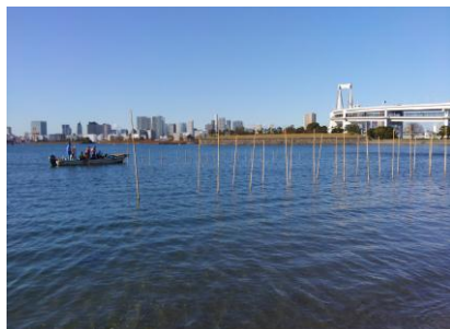
お台場の海に立つひび(支柱)

お台場海苔づくり実行委員を募集しています。また、お台場海苔づくりに参加したい人も募集しています。興味のある方は、ご連絡待ちしています！