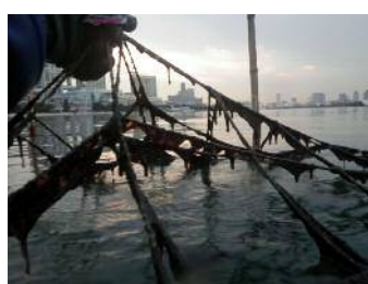
1月5日 (5cm~15cm 程度)