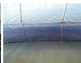
1月9日 (6cm~24cm 程度)