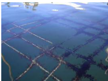
1月1日 (1cm~3cm 程度)